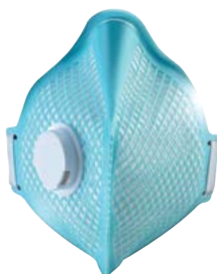
Filtair Flat A-2V